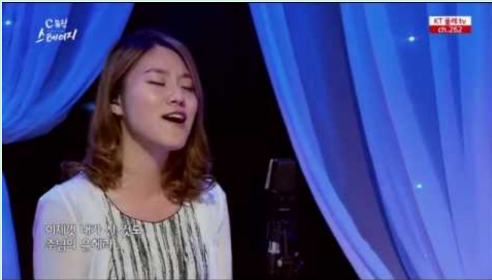
나같은 죄인 살리신